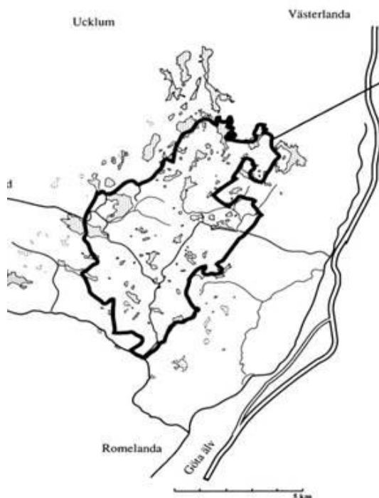
Fig.2. — = Svartedalens naturreservat